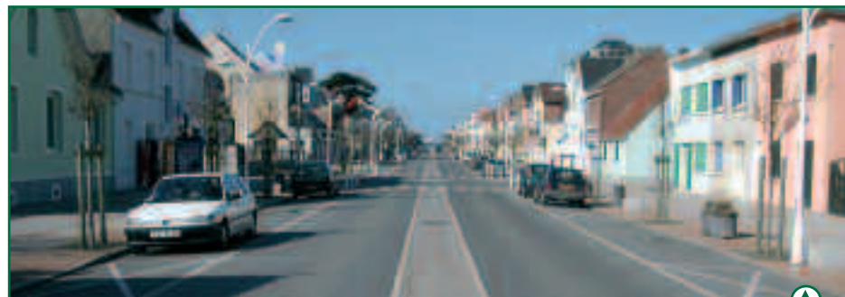
L'Avenue de la Plage mesure près de 2 kilomètres sur 25 m de large

Fort de ce succès, la seconde phase, de la place de l'église à la place