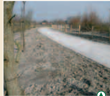
Un tronçon s'achève, un autre démarre

Un nouveau tronçon de 3 kilomètres est ouvert entre Monchaux et La Margueritelle sur la commune de Quend, une piste cyclable dont la bande de roulement est réalisée en béton.