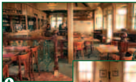
La salle de restaurant

L'effort constant d'amélioration de l'accueil du public a conduit à repenser l'aménagement du Club House.