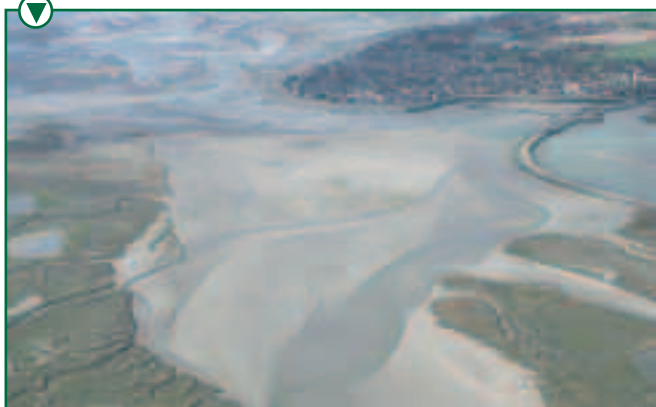
Vue aérienne de la Baie de Somme

Quelques caractéristiques : des passerelles en bois pour le franchissement des fossés, des plantations d'essences locales, saules et roseaux.