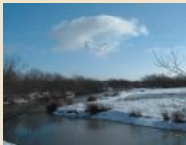
Hiver 2004 - N°31