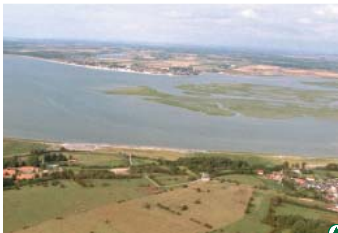
Saint-Valéry-sur-Somme et Le Crotoy