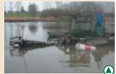
La "dragage-suceuse" en action sur le marais

Une opération de curage du grand étang par aspirodragage des boues est en cours. Un volume de vases évalué à 8 000 m 3 est évacué dans un bassin.