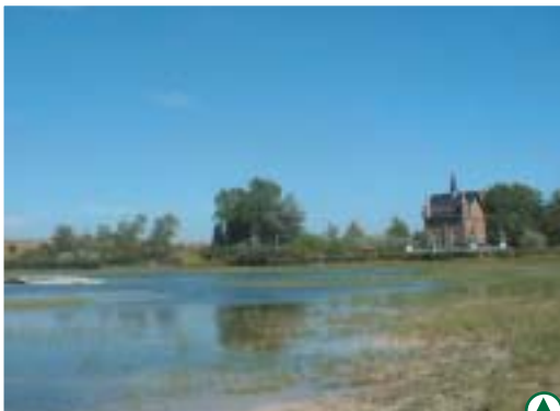
Située dans une zone humide : la Maison Ramsar

*La convention Ramsar vise à la préservation, au niveau mondial, des ensembles exceptionnels des zones humides en tout genre, reconnues comme essentielles à la vie des oiseaux migrateurs.