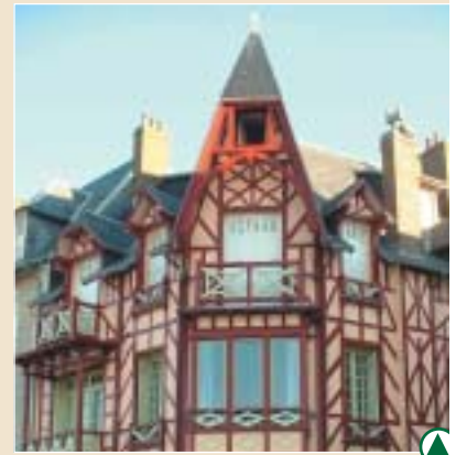
Mers-les-Bains : un patrimoine chargé d'histoire