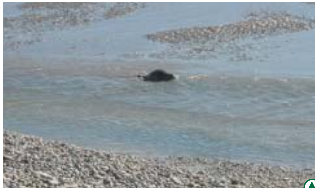
Les phoques de la Baie de Somme

Aujourd'hui, la Baie de Somme ne dispose pas de fonds documentaires aisément accessibles. Créer une banque d'images sur des thèmes tels que l'évolution du trait de côte, les activités traditionnelles, l'exploitation industrielle des ressources natu-