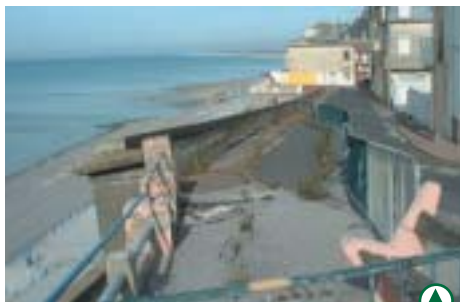
Un ouvrage dangereux (janvier 2003)

Des travaux, sous la maîtrise d'œuvre de la DDE, sont entrepris pour déplacer les réseaux et démolir partiellement le mur de soutènement.