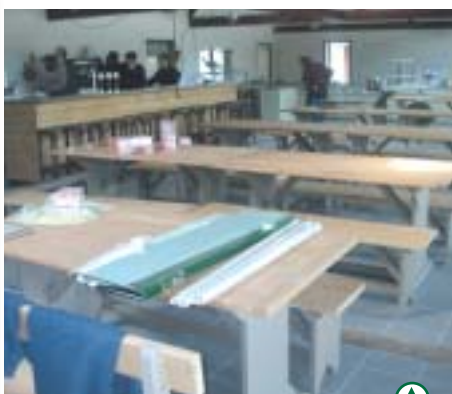
Travaux d'aménagement intérieur du pavillon

L'année 2003, malgré les difficultés conjoncturelles, devrait nous permettre de vérifier une fois encore que le Parc Ornithologique du Marquenterre est le fleuron des équipements touristiques de la Baie de Somme.