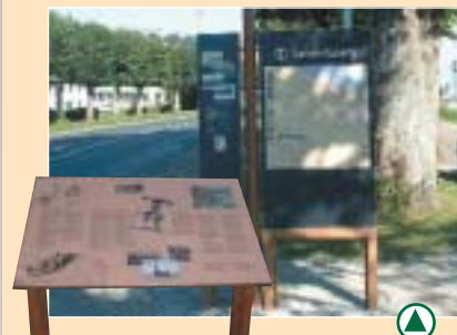
Mise en place d'une signalétique touristique sur la commune de Saint-Valery-sur-Somme

La taxe de séjour 2002 a été utilisée, par les communes de la Côte Picarde, pour embellir, fleurir et entretenir leurs espaces publics, pour soutenir financièrement les offices du tourisme et développer les animations estivales et surtout pour favoriser un aménagement urbain de qualité.