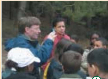
La Baie de Somme : un héritage à transmettre