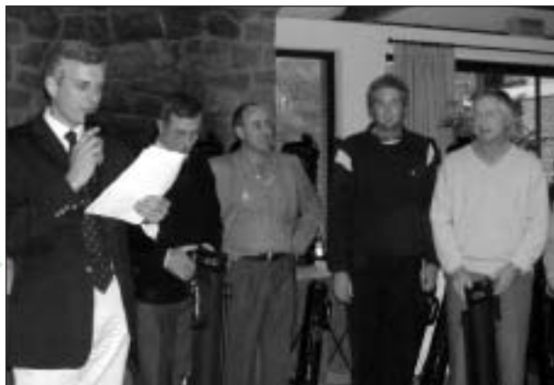
Lors de la remise des prix au Touquet

De nouveaux partenaires, toujours plus prestigieux, étaient présents tels que Paco Rabanne, Volvo et des tirages au sort exceptionnels ont été offerts par Belle Mare Plage, Air Mauritius et Orient Express.