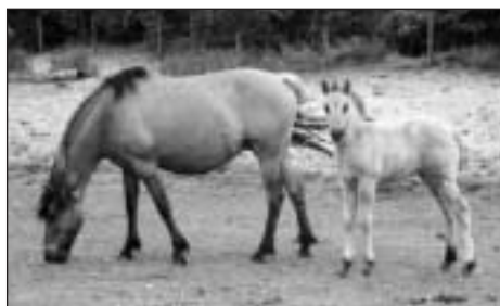
Les chevaux font partie intégrante de la Réserve

Celui-ci définit les conditions de mise à disposition des herbages, en contrepartie de la formation équestre des agents.