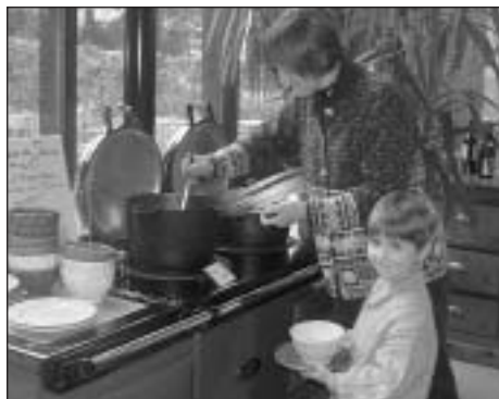
Venez goûter aux saveurs nouvelles des Jardins de Valloires

L'après-midi, les Jardins vous invitent à découvrir des goûters